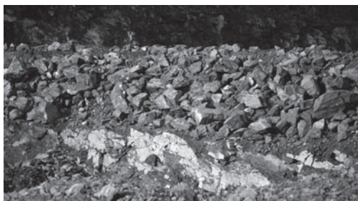
Objekt der Begierde: Warsteiner Kalkstein

Die Gefährdung des Wassers betrifft das gesamte Versorgungsgebiet des Hillenberg- und des Lörmecke-Wasserwerks und damit ein Versorgungsgebiet, über Warstein hinaus,