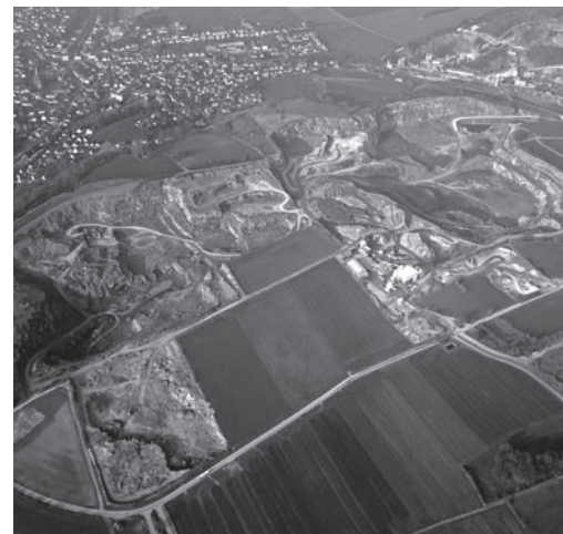
Früher lediglich Löcher in der Landschaft, heute kommt einem die Stadt schon fast wie eine Insel in der Steinabbauwüste vor ...

Warum konnte sich die Steinbruchindustrie in den vergangenen Jahren fast ungehindert ausbreiten? Warum bekommt sie fast nie die „rote Karte“ gezeigt? Warum fahren die Steinlaster weiterhin vielfach ohne Pläne? Warum werden die Interessen der Bevölkerung, die unter dem Steinabbau leidet, nur so schwach vertreten?